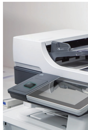
Acceso a copiadora