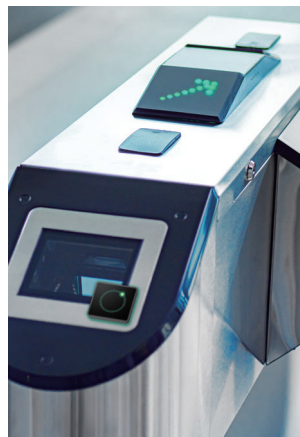
Compuerta de velocidad