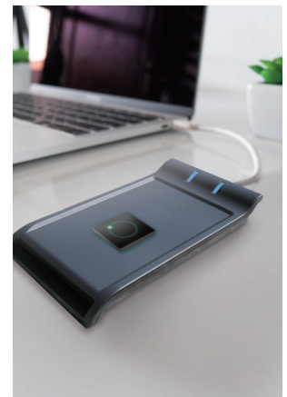
Inicio de sesión en PC