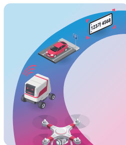
다양한 외부 시스템과 연동

LIDAR, 열 감지 센서, CCTV, 순찰 로직을 연결해 위협 감지를 한층 더 정교하게 강화.