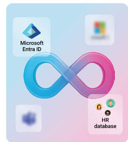
엔터프라이즈 ID 연동

차량 관제, 로봇 경비, 방문객 관리, 근태관리, 엘리베이터, 스마트 존 로직까지 각 요소를 유기적으로 통합해 끊임 없는 사용자 여정을 완성.